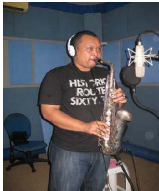
Gambar 6. Ruang Tracking/Take/Rekaman Jack's One Studio

Ruang kontrol/ ruang Mixing, Editing , dan Mastering (dapat dilihat pada gambar 7), merupakan ruangan untuk melakukan pengoperasian (mengontrol) sistem kerja alat-alat untuk rekaman baik secara track maupun live . Ruang ini membutuhkan standar ruang akustik. Tanpa ruang kedap suara kemungkinan proses rekaman menjadi panjang karena banyak suara yang bocor atau pun mengganggu masuk ke dalam rekaman dan merusak sebuah musik (lagu). Ruangan tersebut memerlukan penanganan akustik yang berbeda karena ruangan tersebut harus dapat mendukung tiap frekwensi suara yang bermacam-macam dari alat-alat musik yang terlibat dalam proses rekaman.