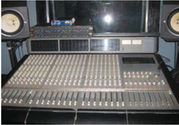
Gambar 3. Input Media (M-audio controller) yang berfungsi sebagai pengatur line instrumen musik.

dan diatur kemudian dikuatkan oleh penguat akhir atau power amplifier. Pada umumnya ada beberapa menu yang terdapat pada mixer controller yaitu: gain , equalizer pada channel , dan swepable equalizer . Jack's One studio memakai input media (M-audio controller) merk Tascam dan memiliki 24 channel routing out put (seperti pada gambar 3).