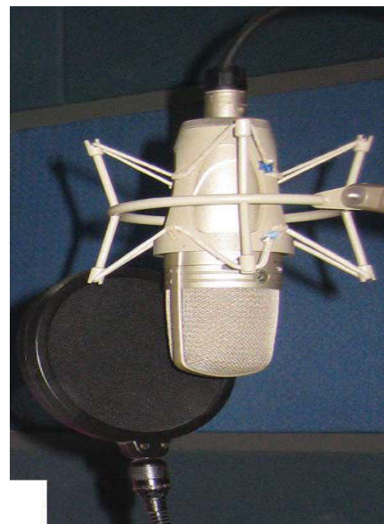
Gambar 2. Input Media yang di gunakan Jack's One Studio merk Shure Microphone

Microphone adalah suatu alat yang berfungsi untuk mengubah energi-energi akustik (gelombang suara) menjadi sinyal listrik. Microphone sering digunakan di tempat-tempat seperti radio, studio rekaman dan lain sebagainya. Di studio rekaman mikrophone berfungsi sebagai penangkap suara vokal maupun instrumen yang akan direkam. Kualitas dari microphone yang digunakan dalam rekaman menjadi salah satu penentu hasil rekaman. Jack's One Studio memakai microphone jenis kondensor merk Shure (seperti pada gambar 2).