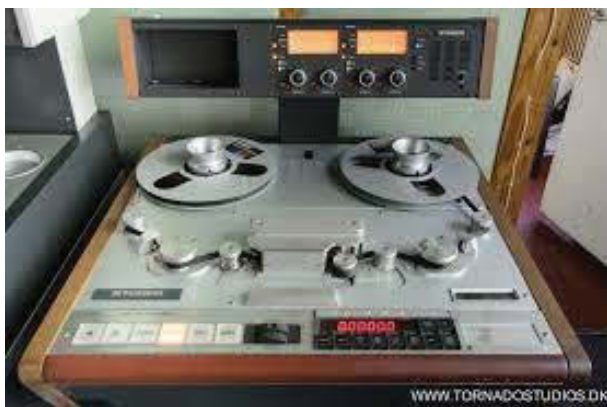
Gambar 1. Multitrack Recording

Pada tahun 1940-an dimulai eksperimen dengan menggunakan multitrack recording (seperti gambar 1) yang terus berkembang menjadi lebih rumit hingga tahun 1960-an. Dengan adanya multitrack recording , teknik merekam dengan memisahkan grup artis dapat dilakukan. Efek lain yang ditimbulkan oleh multitrack recording ini adalah munculnya suara stereo . Pada tahun 1930-an mulai bereksperimen dengan merekam menggunakan dua microphone , dua amplifier , dan dua speaker yang menyebabkan efek aural yang menyenangkan (Pratiwie, 2009: 1).