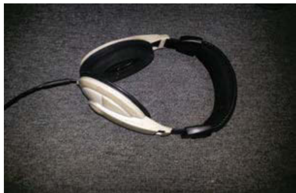
Gambar 5. Headphone merk Samson yang digunakan di Jack's One Studio

Headphone berfungsi untuk memonitor hasil recording . Alat ini sangat berguna misalnya saat kita ingin take suara instrumen, sambil mendengarkan panduan pola musik yang sudah diaransemen. Dengan menggunakan headphone , musik akan terdengar lebih fokus. Jack's One studio memiliki headphone merk Samson dengan kualitas baik pada saat take vokal. Suara yang dihasilkan headphone tersebut setereo (seperti pada gambar 5).