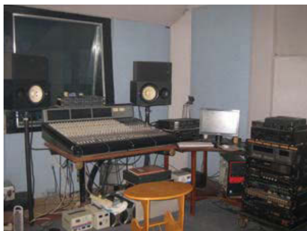
Gambar 7. Ruang kontrol/ ruang Mixing, Editing, dan Mastering Jack's One Studio

Studio Jack's One studio memiliki ruangan tunggu dan sekaligus ruangan kantor yang berada di belakang studio. Ruangan ini berfungsi untuk melaksanakan semua administrasi dan sekaligus juga sebagai ruang tamu yang dilengkapi dengan perlengkapan penunjang untuk memantau ke dua ruangan lain, ruangan tersebut disediakan agar dapat memantau proses selama latihan maupun rekaman.