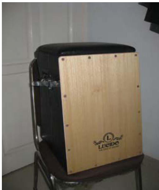
Gambar 10. Instrumen musik Cazon yang dimainkan dalam proses recording lagu O Tao Toba dan Pulo Samosir .

Instrumen gitar akustik (dapat dilihat dalam gambar 11) dalam recording musik O Tao Toba dan Pulo Samosir adalah sebagai pembawa akord . Begitu juga dengan alat musik gitar elektrik adalah sebagai ‘mempertebal’ suara akord sehingga aransemen musik pada lagu O tao Toba dan Pulo Samosir kedengaran seperti musik modern tetapi tetap menggambarkan suasana disekitaran pinggir Danau Toba.